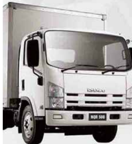
خاور برای ۴ تن و بیشتر از آن

این محصول با توجه به سفارشات مختلف و مقدار مختلفشان با ماشین های باری مختلف ارسال می شوند.