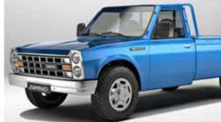
نیسان برای بارهایی تا مجموعاً ۲ تن