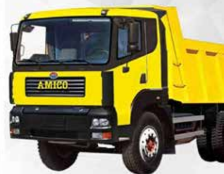
کامیونت تک محور برای بارهای تا حداکثر ۱۰ تن