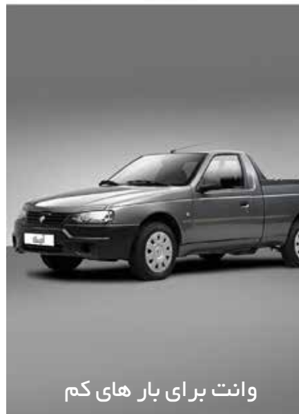
وانت برای بارهای کم