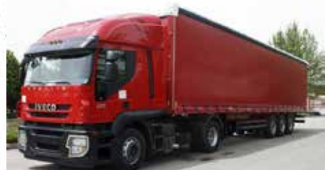
کامیونت دو محور برای بارهای تا حداکثر ۱۵ تن